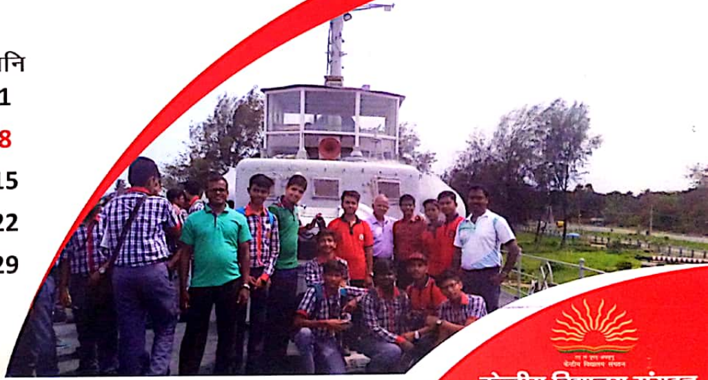
कारवार में सीमा दर्शन कार्यक्रम