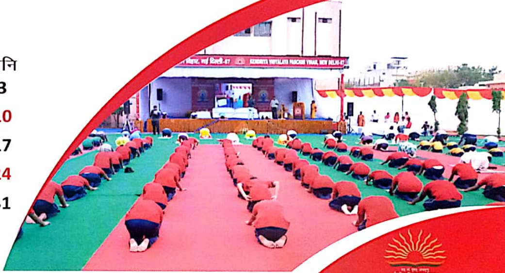
केन्द्रीय विद्यालय पश्चिम विहार, दिल्ली में अंतर्राष्ट्रीय योग दिवस (21 जून 2018)