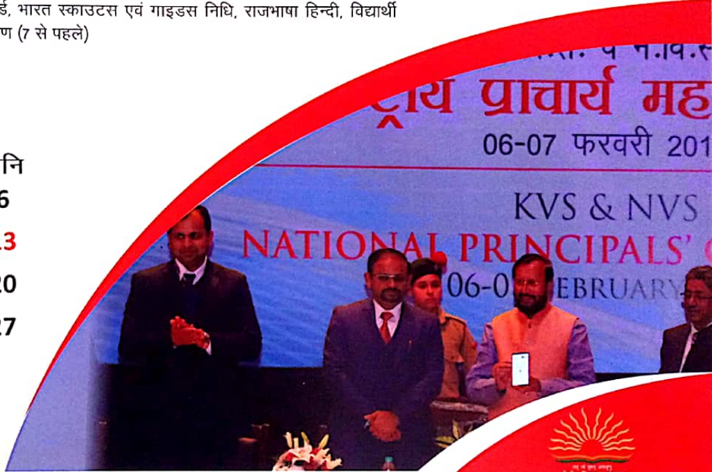
के.वि.सं.-न.वि.स. राष्ट्रीय प्राचार्य महासम्मेलन-2019 (प्रथम संयुक्त) 6-7 फरवरी 2019